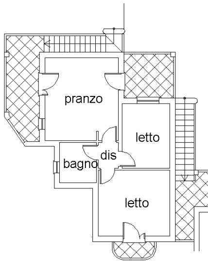
- PIANO PRIMO - Hm = 2,70